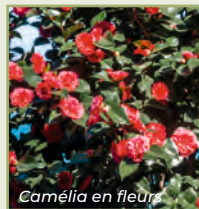
Camélia en fleurs